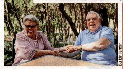
Bu bir illandır.