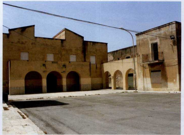
Terk edilmiş köy

Scopello ile Trapani arasında terk edilmiş bir köy bulduk tesadüfen.